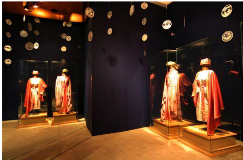
Vestits de Sibil·la del santuari de Lluc (fotografia de l'exposició: Sibil·la. Cant, mite i tradició)

1. A partir de fotografies, vídeos, fonts iconogràfiques i textos descriptius i/o literaris, explica com és el vestit d'una sibil·la, de quines parts consta i quins materials es poden fer servir per confeccionar-lo. Dibuixa i pinta un model de sibil·la amb totes les parts estudiades.