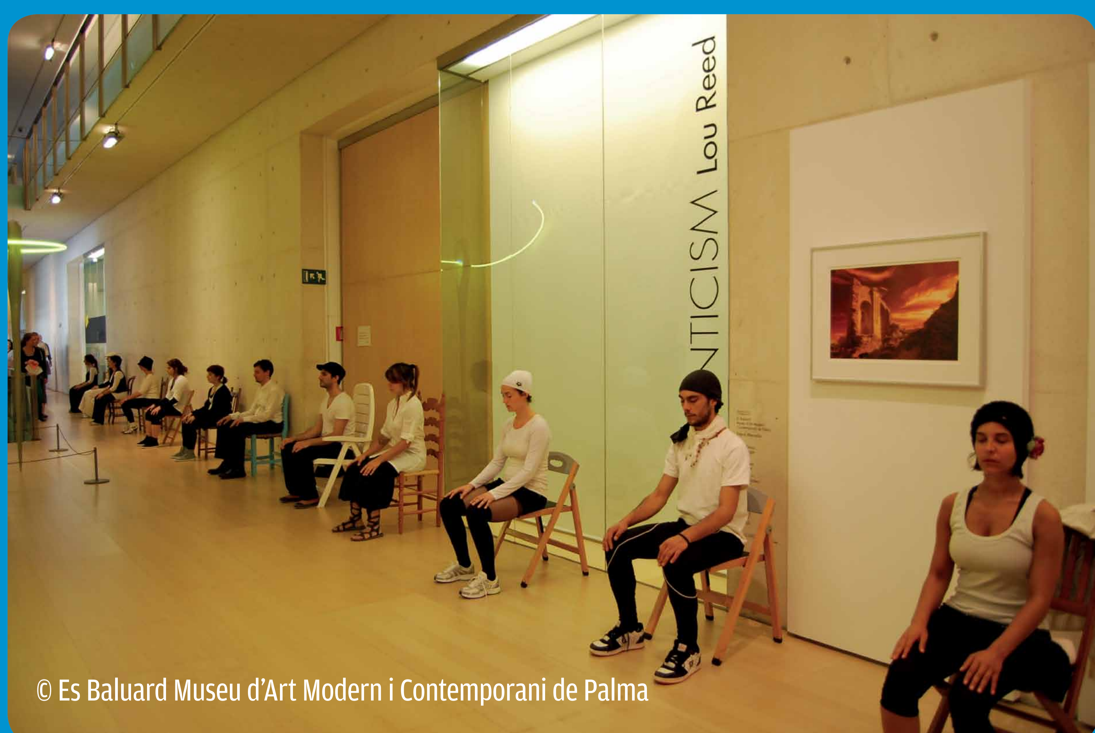
© Es Baluard Museu d'Art Modern i Contemporani de Palma