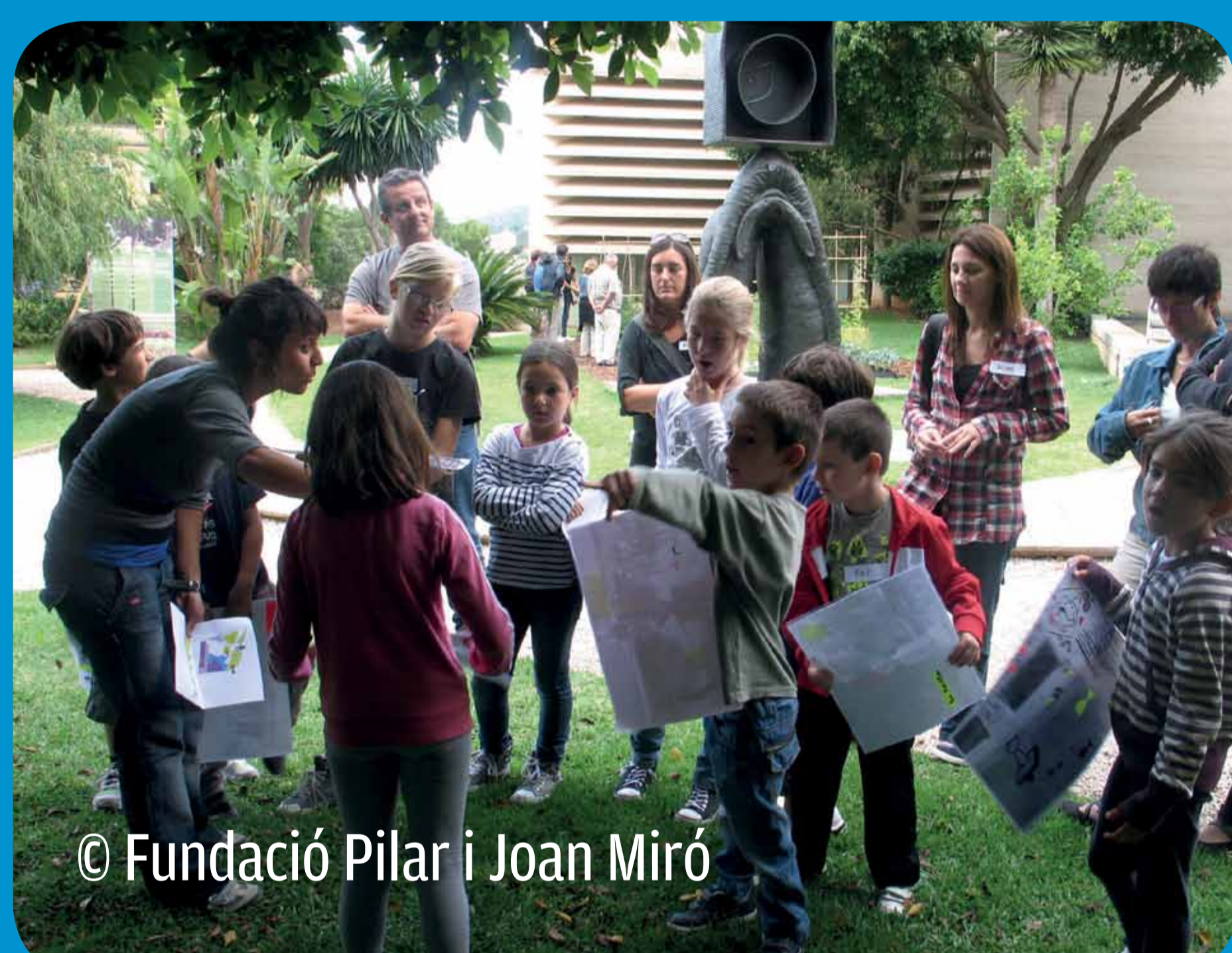
© Fundació Pilar i Joan Miró