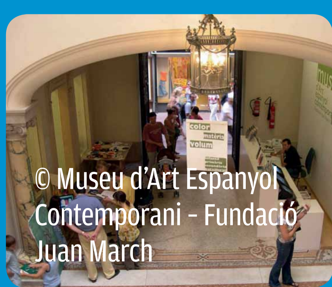
© Museu d'Art Espanyol Contemporani - Fundació Joan March