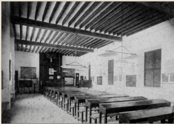
© Arxiu General del Consell de Mallorca, F-1. Aula de l'escola de la Casa de la Misericòrdia

L'edifici mantingué l'ús com a asil de beneficència fins al 1977. Des de llavors, està en mans del Consell de Mallorca, com a institució hereva de la Diputació Provincial, que l'ha destinat a diferents serveis i equipaments culturals.