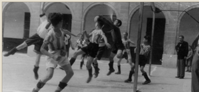
I-77/7. Un partit de futbol al pati dels homes

Quan una persona era admesa a l'asil, era obligada a banyar-se i, en el cas dels homes, a rapar-se el cabell. Els residents s'havien de despertar a les set (set i mitja a l'hivern), oir missa i treballar als tallers o anar a classe. L'edifici disposava de tallers de sabateria, fusteria o impremta i escola de nins i de nines.