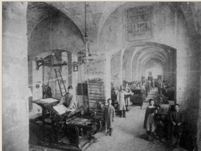
F-2. La impremta

El menjar, excepte en les ocasions especials, era «en règimen de cocina casera sin necesidad de adornos, salsas ni exquisiteces». Cap a les sis de l'horabaixa es resava el rosari, a les set se sopava i a les nou i mitja, llit i silenci.