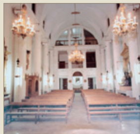
© Arxiu General del Consell de Mallorca, V-691/13. La capella l'any 1979

Construïda entre 1831 i 1836, s'ha atribuït a Joan Sureda. De planta basilical, absis interiorment semicircular, coberta de mig canó amb cassetons i monumentals columnes jòniques adossades als murs, segueix models neoclàssics. Els retaules i el mobiliari, una part dels quals procedien de l'extingit convent dels trinitaris, es dispersaren arran de la utilització de la capella per a usos culturals.