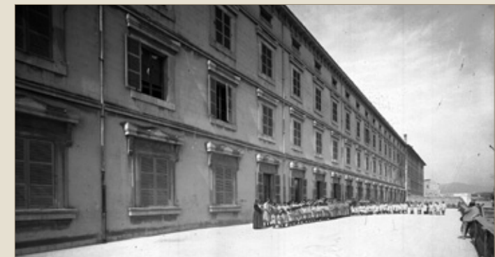
© Arxiu del So i de la Imatge, fons Rul-lan. Els infants orfes, acompanyats de les monges i els mestres, a la terrassa de la Misericòrdia, l'any 1934

Devers el 1870, es construí un segon bloc que es destinà als homes, mentre que la part que ja existia quedava reservada a les dones. Es tracta d'un edifici auster, funcional, en el qual predomina la nuesa arquitectònica. Els pisos superiors albergaven els dormitoris i diversos tallers de treball, mentre que els inferiors estaven destinats a dependències administratives, magatzems, cuines, menjadors i l'oratori.