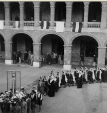
© Arxiu General del Consell de Mallorca, I-77/7. Processó al pati dels homes, devers 1950

La Casa de la Misericòrdia era una institució benèfica fundada pels jesuïtes el 1565. El 1677 es traslladà a una gran casa amb hort devora l'Hospital General, la qual es degué anar deteriorant, motiu pel qual l'any 1817 Pere Joan Bauçà, mestre d'arquitectura, féu els plànols d'un nou edifici. Entre 1817 i 1845 es dugué a terme la primera fase de la construcció, que és la que s'ubica a l'actual