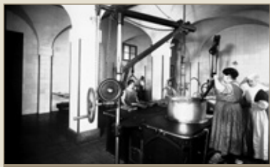
© Arxiu del So i de la Imatge, fons Rul-lan. La cuina de la Misericòrdia, devers la dècada de 1940

Gràcies al reglament publicat l'any 1946, podem fer-nos una idea de com vivien els asilats de la Misericòrdia a l'època de la post-guerra. La institució acollia orfes i persones sense recursos que, per la seva edat avançada o per problemes físics, no es podien mantenir. Homes i dones residien en zones separades i cada departament es dividia en menors (de 10 a 15 anys), majors (de 15 a 21 anys) i ancians (la resta).