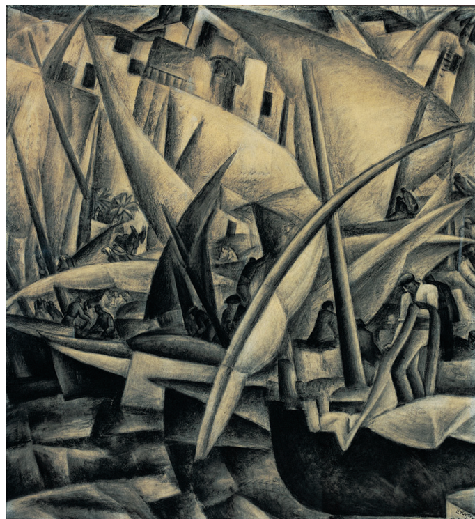
Leo Gestel, Palma Haven (1914)

Sense abandonar l'expressionisme ens ofereix una estampa de la ciutat en carbonet, més aviat vinculada al futurisme. El ritme del quadre ve marcat per les veles de les barques del port de Palma amb les palmeres i en segon terme, els edificis del Terreno darrere.