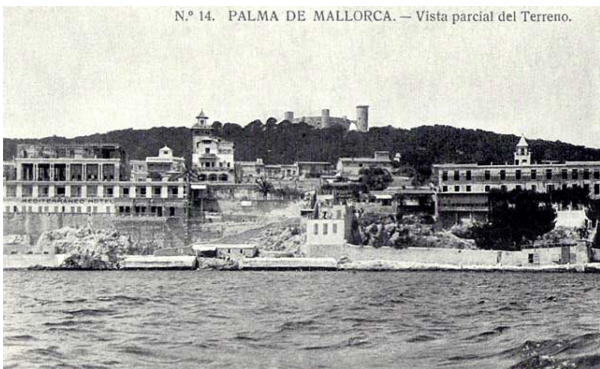
Postal antiga de la façana marítima del Terreno

El Terreno va ser una de les primeres zones d'estiueig de la burgesia palmesana en el canvi de segle XIX al XX. Llavors, el petit nucli residencial quedava enfora de la ciutat, tenia el bosc darrere i, davant, la mar, constituint una façana marítima, una balconada que s'obria directament a la mar, sense la interrupció del passeig Marítim que no es construí fins els anys cinquanta del segle XX. Aquest és un factor decisiu perquè s'hi instal·lin els artistes nous. La barriada és un lloc idíl·lic de la costa mediterrània per a qui la descobreix per primera vegada. També és important a l'hora d'establir-se en un indret com el Terreno, el preu del lloguer de les cases, habitualment unifamiliars envoltades de terreny de jardí o d'hort, delimitat per tanques, que era molt econòmic per als estrangers. Hem de pensar que cap a 1845 s'edifiquen les primeres cases a Can Barberà, vorera de mar i a partir d'aquí, el procés urbanitzador progressa molt ràpidament. El 1859 es va donar permís per fer trenta-quatre casetes. El 1886 es posen els noms als carrers i en la mateixa dècada el barri ja té l'aspecte d'un nucli residencial d'estiueig.