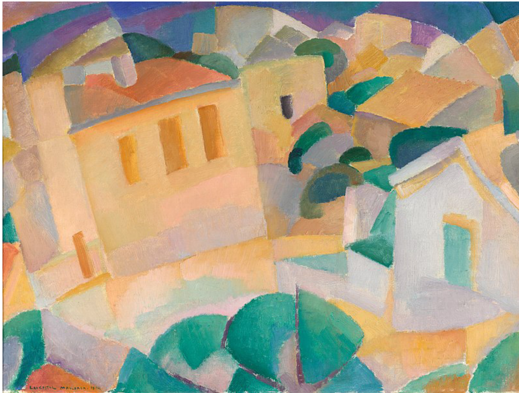
Leo Gestel, Mallorca Terreno (1914)

Sense abandonar l'expressionisme ens ofereix una estampa de la ciutat en carbonet, més aviat vinculada al futurisme. El ritme del quadre ve marcat per les veles de les barques del port de Palma amb les palmeres i en segon terme, els edificis del Terreno darrere.