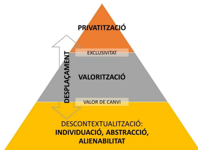
FIGURA 2. COROL·LARI DERIVAT DE LA MERCANTILITZACIÓ A PARTIR DE CASTREE (2003)

Aquí es proposa una reflexió crítica de la mercantilització, a fi de comprendre millor com es relacionen els diferents processos que la componen. Les pràctiques de gestió i conservació a la serra de Tramuntana es poden relacionar amb processos de mercantilització. No obstant això, la definició per Castree (2003) requereix aclariments en referència a l'estructuració dels processos. Es proposa la figura 2 per visualitzar de manera simplificada les relacions entre els diferents processos.