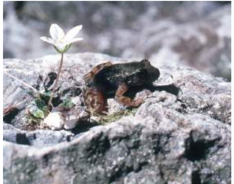
Ferreret ( Alytes muletensis ).

Cal observar que no és un inventari exhaustiu, i que les observacions es realitzaren, principalment, durant les campanyes de recerca del ferreret ( Alytes muletensis ), durant la dècada dels 80 del segle passat (MAYOL et al., 1980; HEMMER & ALCOVER, 1984).