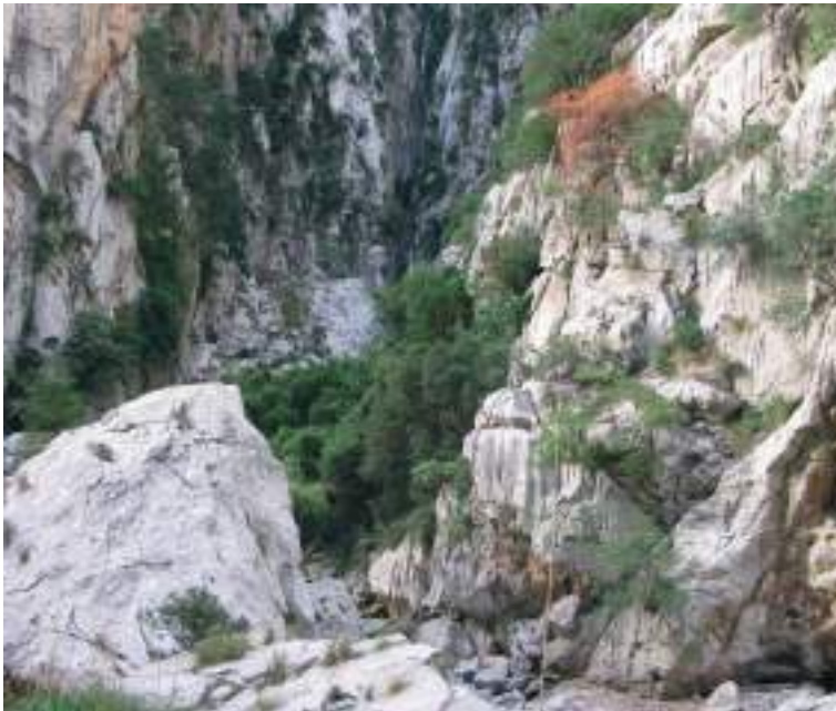
Torrent de Pareis (Escorca).