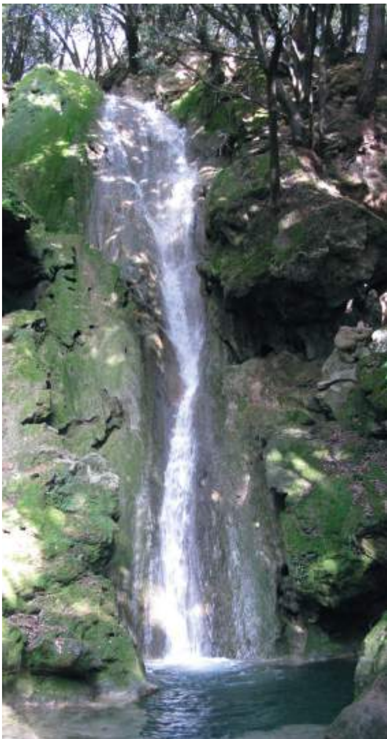
Torrent de Coanegra (Santa Maria del Camí).