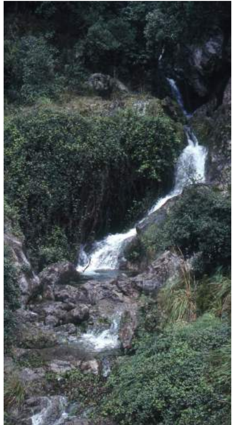
Torrent d'Almallutx (Escorca).