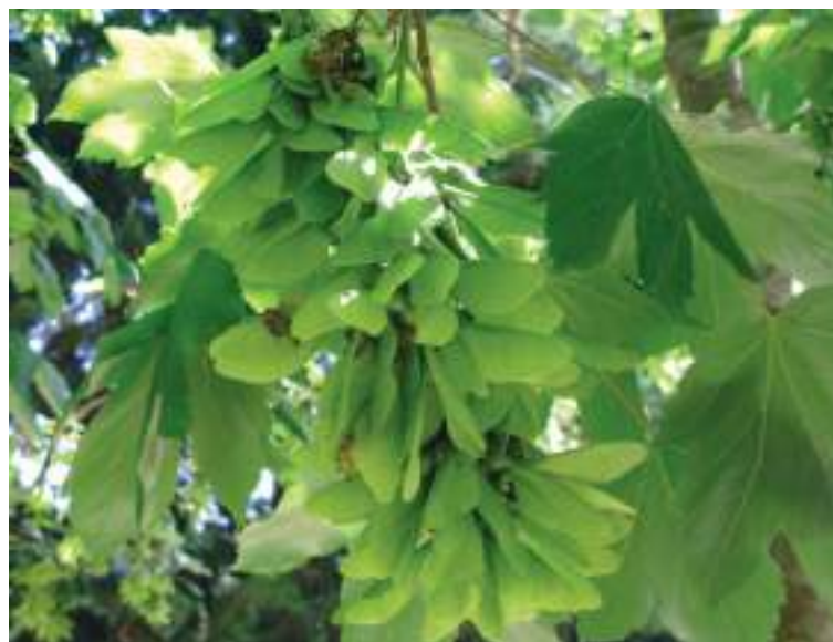
Acer opalus subsp. granatense