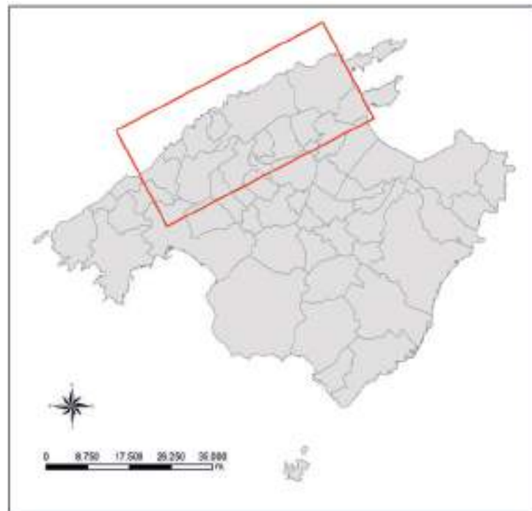
Mapa 1. Àrea d'estudi a l'illa de Mallorca.

En les dues taules següents els torrents arranats es reparteixen per tres conques hidrològiques. S'ensenyen els municipis per on fluïen, així com la longitud (del tram encaixat) i el desnivell.