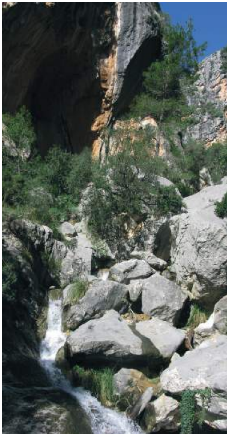
Torrent Cúber (Escorca).