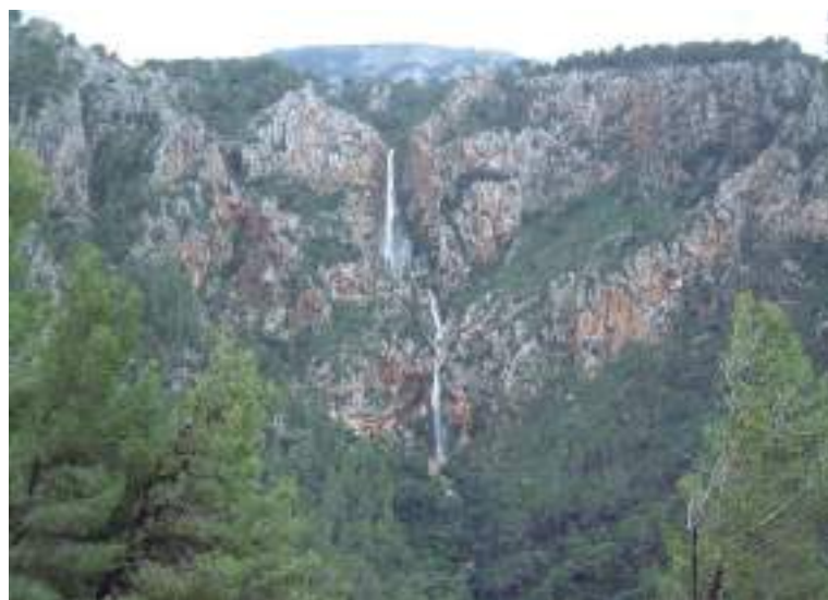
Torrent des Salt (Valldemossa).