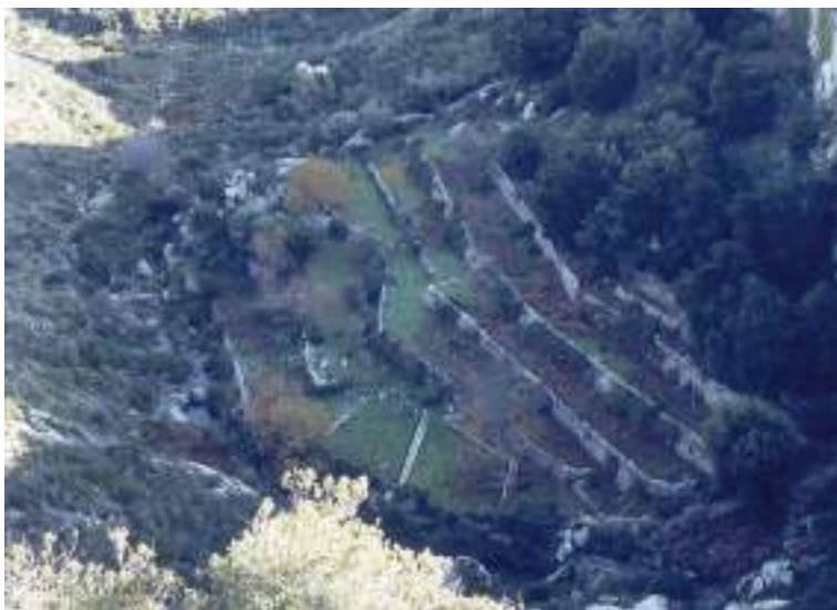
Torrent de s'Hort des Molí (Mortítx, Escorca).

La ramaderia extensiva d'ovelles, bous i porcs també s'ha donat a aquests indrets, com gairebé a tota la Serra; encara que estava molt condicionada per l'orografia i la inaccessibilitat de molts dels indrets. (Ordines et al. 1995).