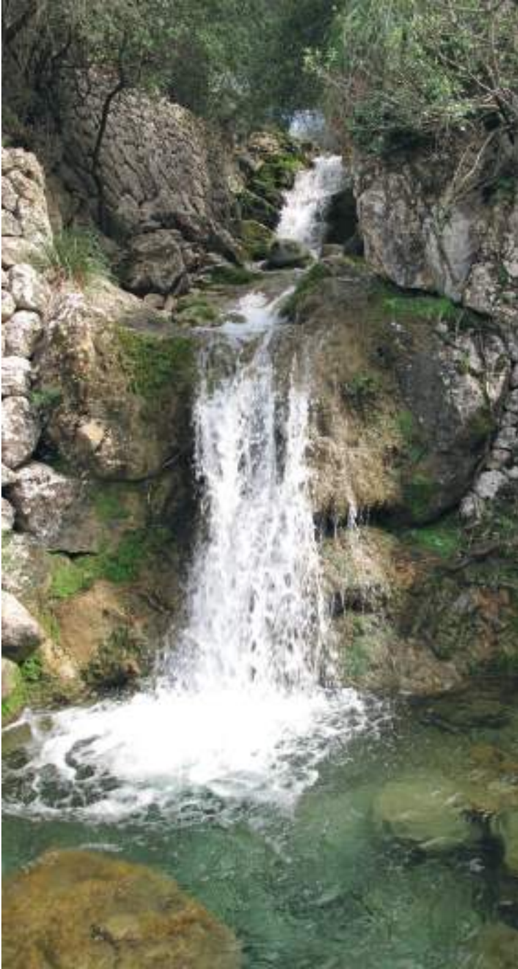
Torrent de Lofra (Sóller).