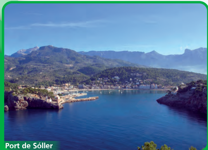
Port de Sóller