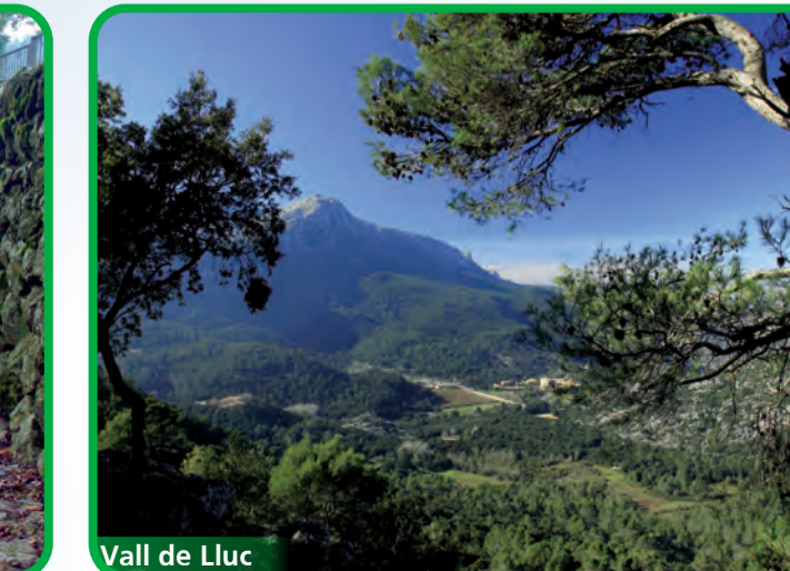
Vall de Lluc