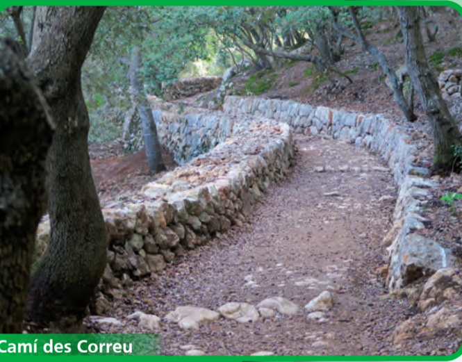
Camí des Correu