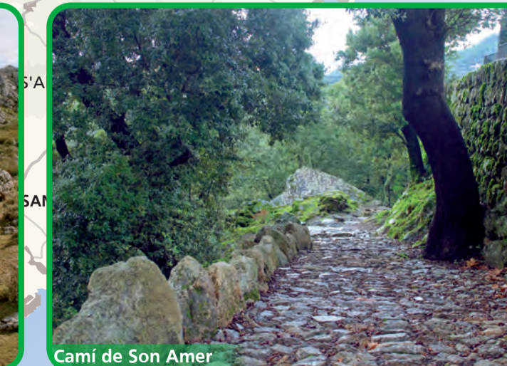
Camí de Son Amer