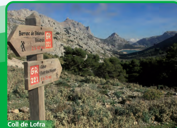
Coll de Lofra