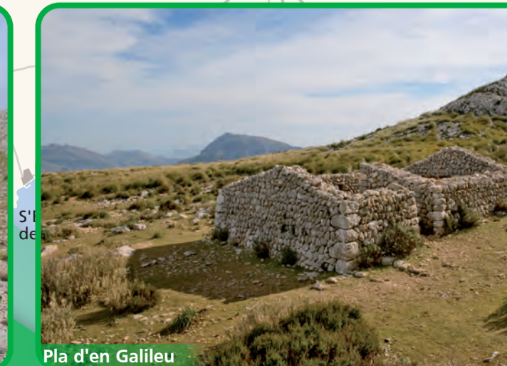
Pla d'en Galileu