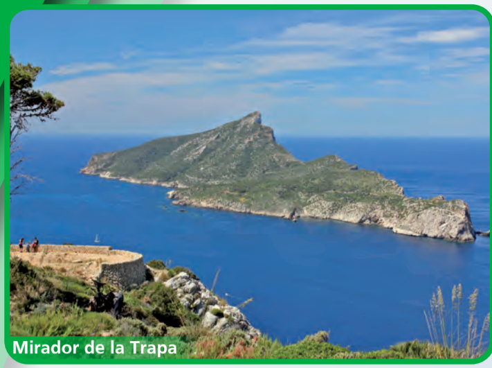
Mirador de la Trapa