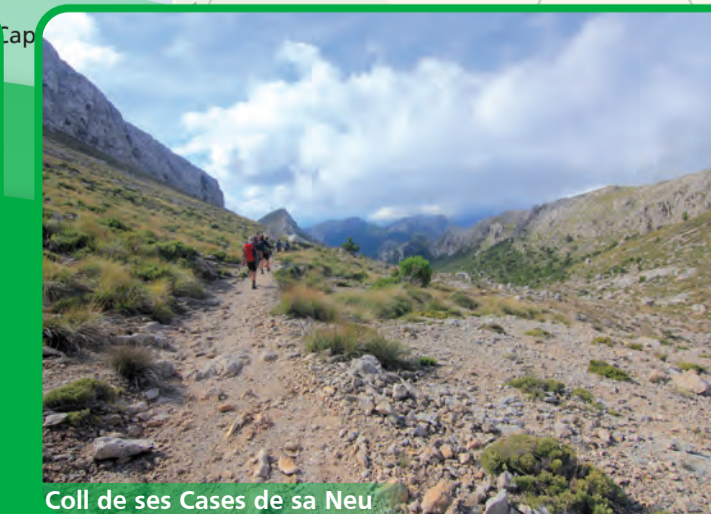
Coll de ses Cases de sa Neu